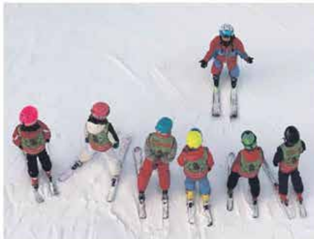
Professora d'esquí amb alumnes a La Molina.